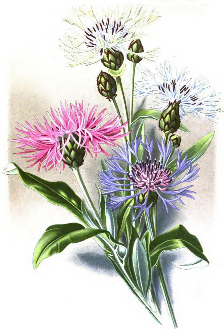
Centaurea montana L.